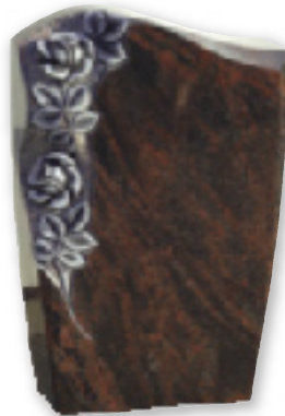
Die Firma E. Hantusch ist stolz auf ihre Ornamentik.

Die E. Hantusch GmbH war schon immer darauf bedacht, neben den gängigen Grabmalmaterialien die regionalen Werksteine wie HOHWALD DIORIT, LAUSITZER GRANIT und SORA LAMPROPHYR am Markt zu halten und deren Marktanteile wieder zu steigern. Besonders bekannt ist das Unternehmen für seine Ornamentik. Neben Rosen, Orchideen, Bäume o.ä. führen die Mitarbeiter verschiedenste Symbole kunstfertig aus. Das Unternehmen ist in erster Linie Grabmalproduzent, fertigt und vertreibt aber auch Natursteinprodukte für den Bau