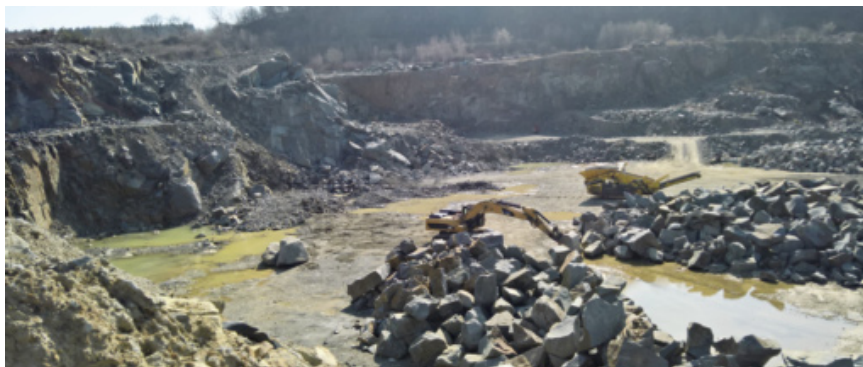
Alle vier bis sechs Wochen sprengt die Firma SKH schonend eine Wand vom Fels. Die Werksteinblöcke werden zumeist direkt im Bruch gesägt.